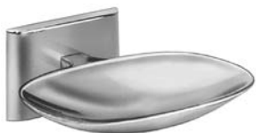
□ 901 PORTE-SAVON (ILLUSTRÉ)