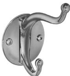
□ 914 CROCHET DOUBLE. SAILLIES DE 38 mm et 90 mm (1-1/2" et 3-1/2") DIAMÈTRE = 70 mm (2-3/4").