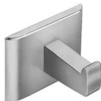
□ 911 PATÈRE SIMPLE SAILLIE DE 44 mm (1-3/4")