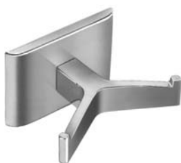
□ 912 Bradex® PATÈRE DOUBLE. SAILLIE DE 51 mm (2")