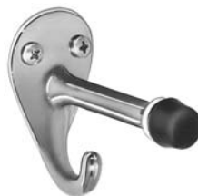
□ 915 Bradex® CROCHET ET BUTOIR. SAILLIE DE 76 mm (3")